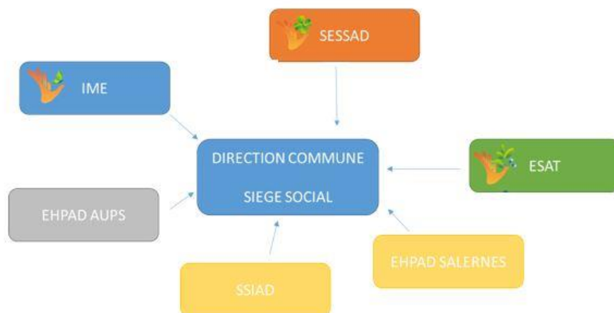
Organigramme général Établissements publics du Haut-var

Le SESSAD s'inscrit dans l' organigramme général de fonctionnement des établissements publics du Haut-Var , comme le montre le schéma ci-dessous :